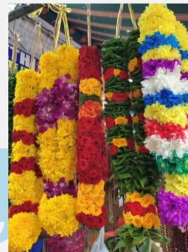
சீ டோங் மற்றும் அவரது சக ஊழியரால் செய்யப்பட்ட பூமாலைகள்